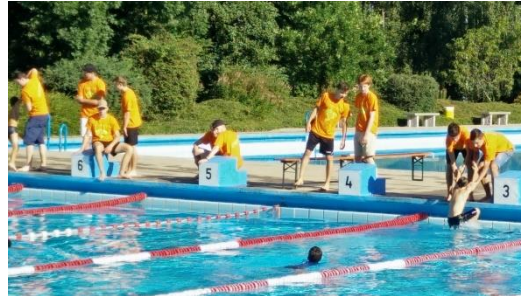
Swim & Run 2018

Lise-Meitner-Gymnasium Kantstr. 1 79639 Grenzach-Wyhlen Telefon: 07624-91289-10 Fax. 07624-912894-0 www.lmg.pcom.de